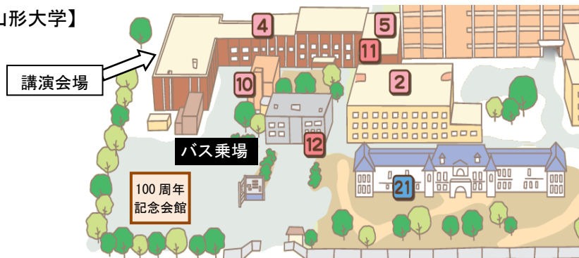
送迎バス乗場の案内